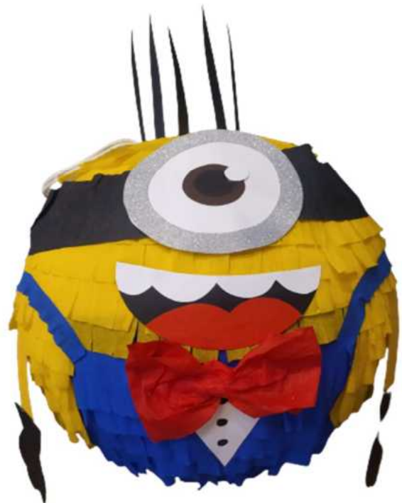
114. Minionek (masa papierowa), obwód 100 cm, H- 40 cm