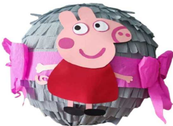
116. Świnka Peppa (masa papierowa), obwód 100 cm, H- 40 cm