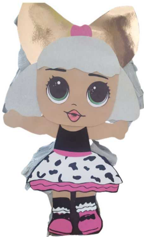
115. Laleczka LOL (konstrukcja kartonowa), H- 60 cm