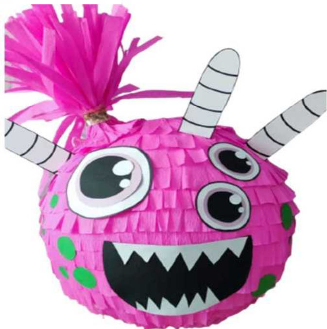
108. Różowy potworek (masa papierowa), obwód 100 cm, H- 40 cm