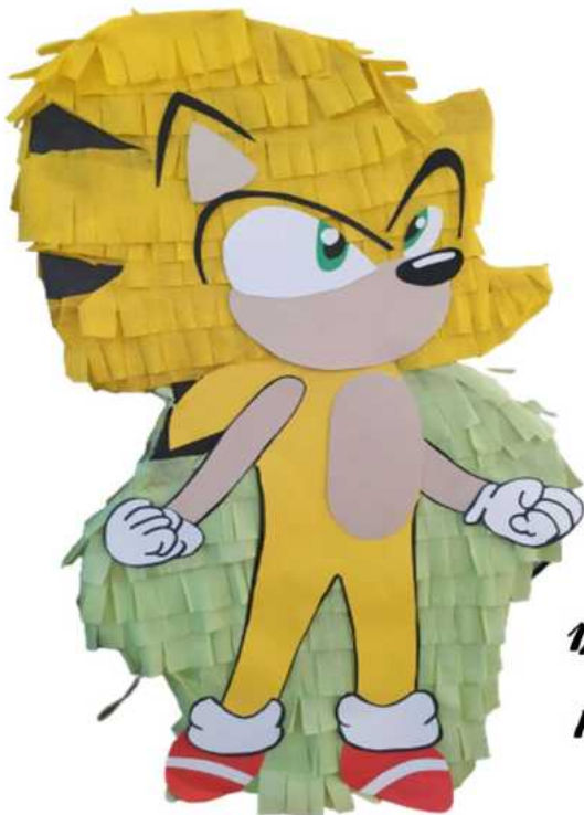
121. Sonic żółty (konstrukcja kartonowa), H-55 cm