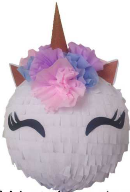
102. Jednorożec (masa papierowa), obwód 100 cm, H- 45cm