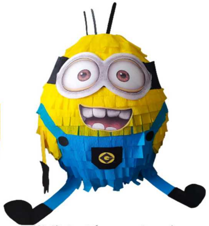
113. Minionek (masa papierowa), obwód 90 cm, H- 40 cm