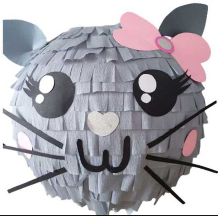
107. Kotek szary (masa papierowa), obwód 100 cm, H- 40 cm