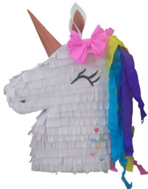
103. Jednorożec (konstrukcja kartonowa), H- 55 cm