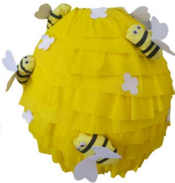
109. Ul z pszczołkami (masa papierowa), obwód 90 cm, H- 40 cm