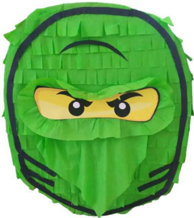
122. Ninja głowa (konstrukcja kartonowa)