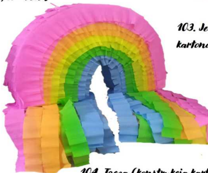
104. Tęcza (konstrukcja kartonowa), H- 35cm