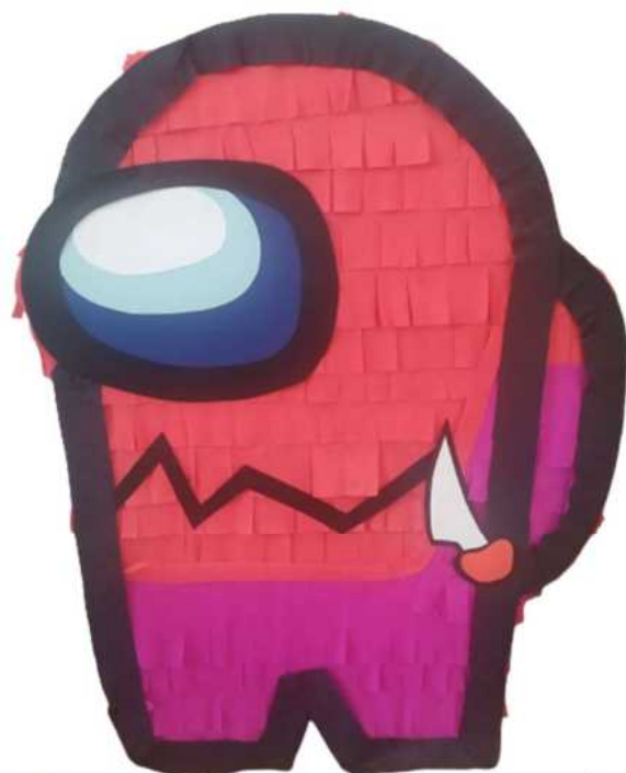
127. Among 3(konstrukcja kartonowa),