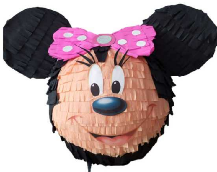
117. Myszka Minnie (masa papierowa), obwód 100 cm, H- 40 cm