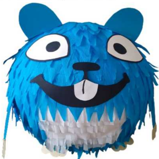
110. Leming (masa papierowa), obwód 100 cm, H- 40 cm