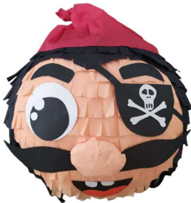
126. Pirat (masa papierowa), obwód 100 cm, H -35/40 cm