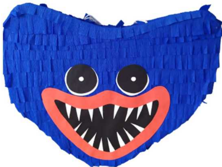
119. Huggy (konstrukcja kartonowa), H- 35 cm