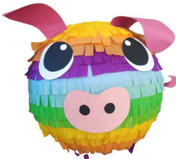
111. Świnka (masa papierowa), obwód 100 cm, H- 40 cm