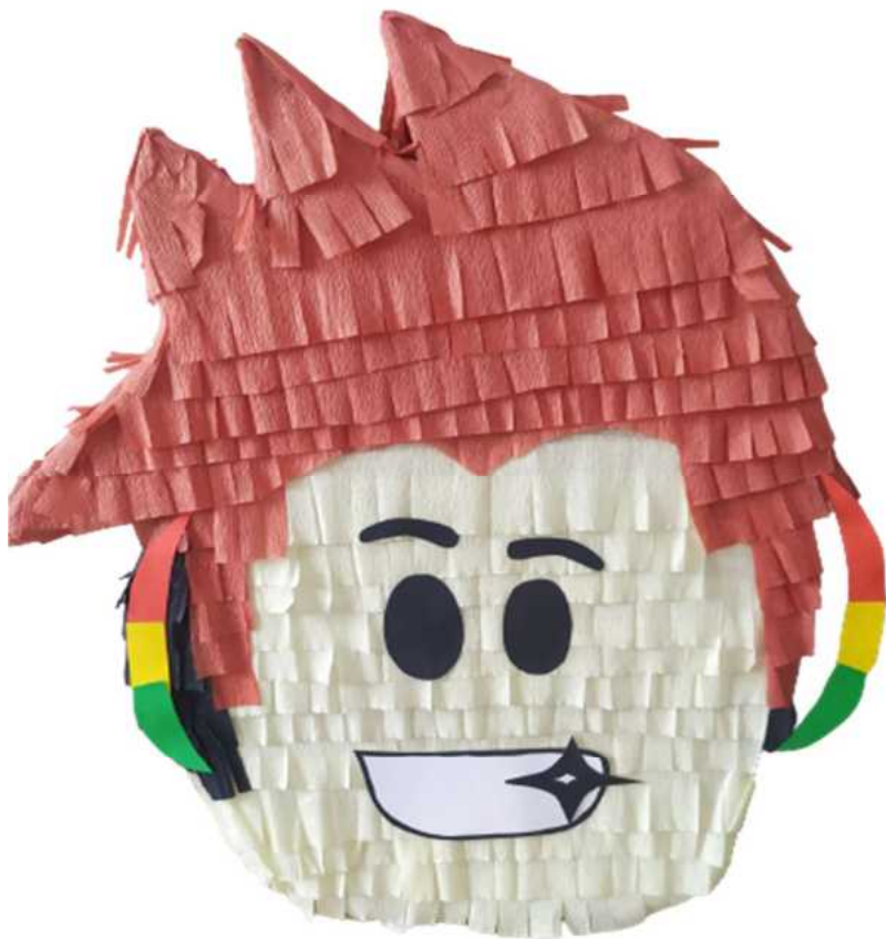
125. Roblox (konstrukcja kartonowa)