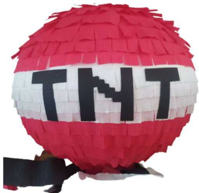
123. TNT kula (masa papierowa),