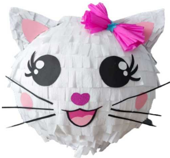
105. Kotek biały (masa papierowa), obwód 100 cm, H- 40 cm