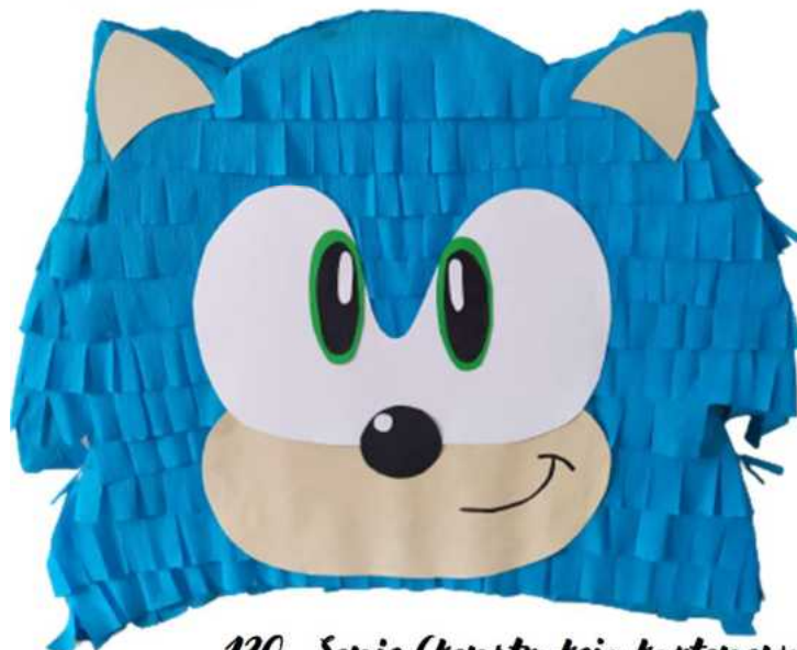
120. Sonic (konstrukcja kartonowa), H- 35/40 cm