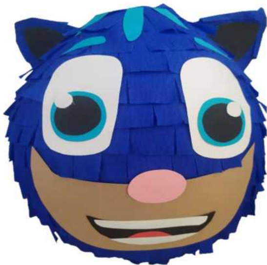
118. Pizamersi (masa papierowa), obwód 90 cm, H-40 cm