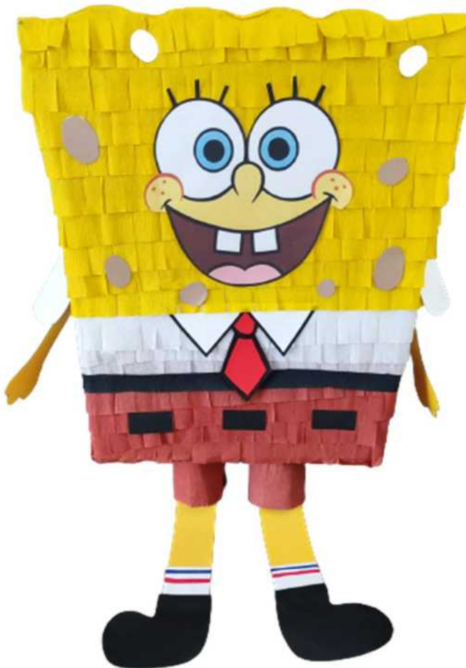
112. SpongeBob (konstrukcja kartonowa), H- 60 cm