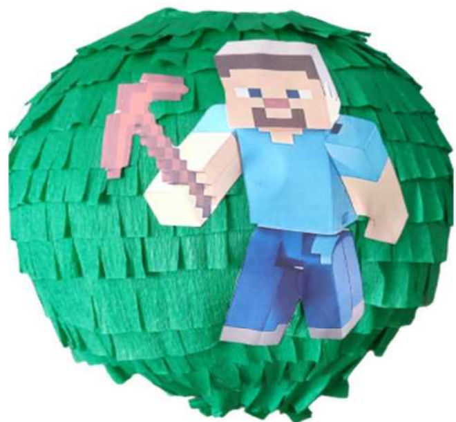
124. Minecraft kula (masa papierowa),