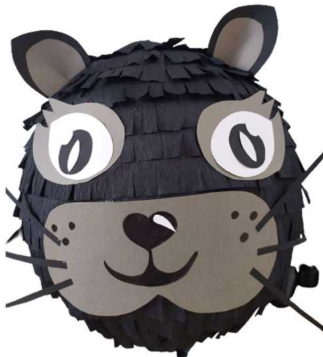
106. Kotek czarny (masa papierowa), obwód 100 cm, H- 40 cm